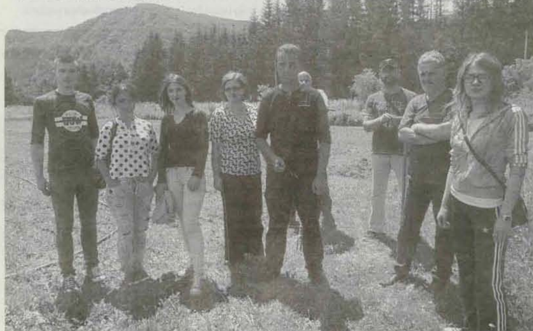
VIŠESTRUKA KORIST: Polaznici obuke juče u Trealjevu