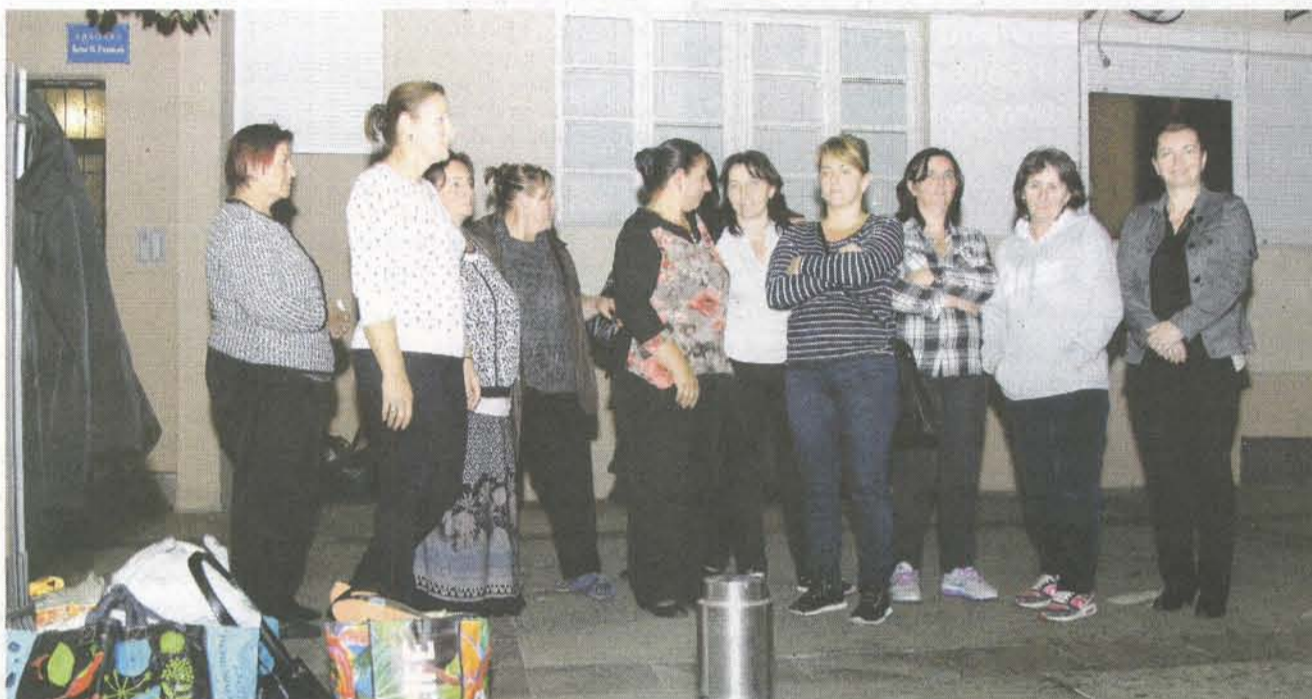
Ministarstvo najavilo reviziju zakona o socijalnoj pomoći: Sa protesta majki sa troje i više djece

Broj nezaposlenih sada iznosi 50 hiljada, u januaru 2016. je bio 40 hiljada, a u istom mjesecu 2015. godine 34 hiljade