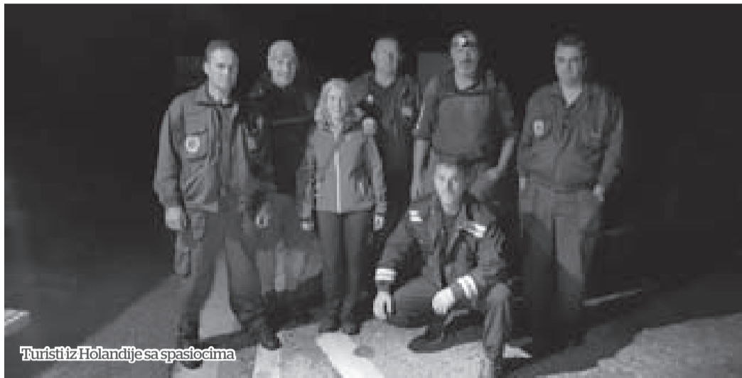
Turisti iz Holandije sa spasiocima

Kako se spuštala noć, turisti su panično mijenjali lokacije, što je doprinijelo da tek treće koordinate budu prave. Bilo bi i te kako rizično da su prenoćili u prašumi, rekao je za Pobjedu Boban Brković, jedan od spasilaca