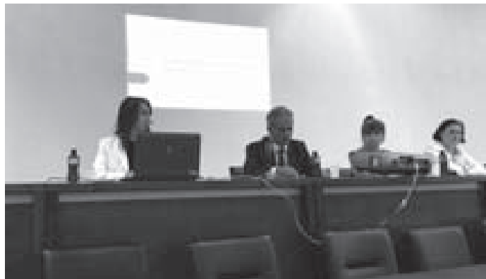
Sa jučerašnjeg okruglog stola

Održan okrugli sto o nacrtu zakona za smanjenje nezaposlenosti