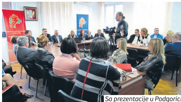
Sa prezentacije u Podgorici

"Kroz taj proces gledamo šta lice može da radi: da li je