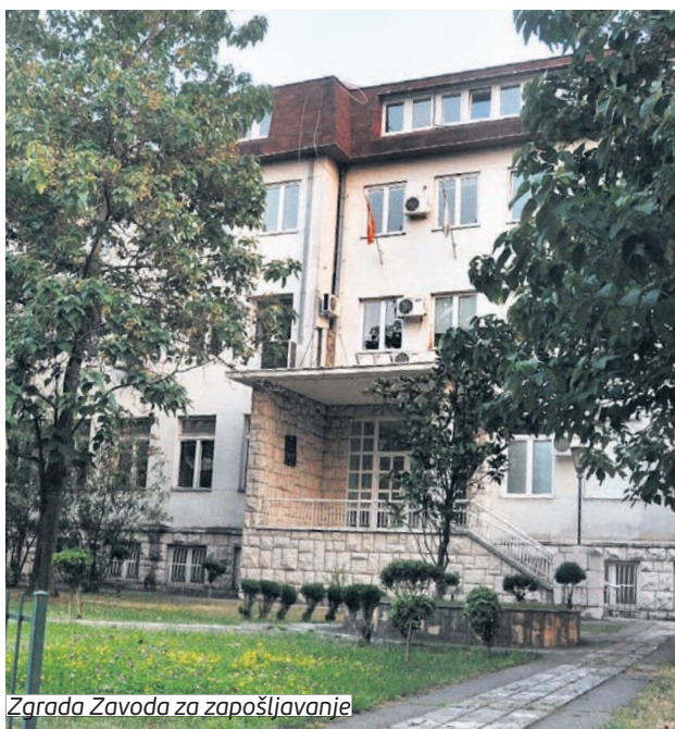
Zgrada Zavoda za zapošljavanje

Sezonsko zapošljavanje je prilika za veliki broj Roma i Egipćana da, makar i na kraće vrijeme, zasniju radni odnos. Tokom devet mjeseci 2017. godine na ovaj način zaposleno je 49 lica (26 žena). A, 28 pripadnika rom-