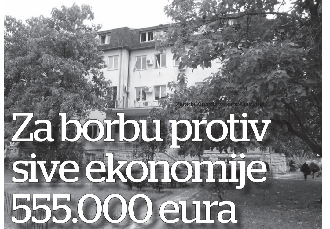
Zgrada Zavoda za zapošljavanje

sive ekonomije - precizira se u saopštenju.