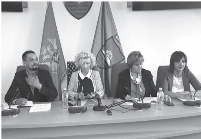
RADITINA OSVJEŠĆIVANJU GRAĐANA: Sa javne rasprave u Bijelom Polju

Javna rasprava o zakonu o istopolnom partnerstvu