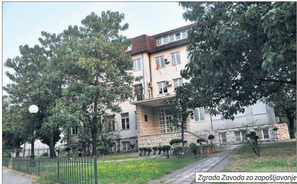
Zgrada Zavoda za zapošljavanje

Broj nezaposlenih u drugom kvartalu ove godine smanjen za 6,5 odsto, navodi se u MONSTAT-ovoj Anketi o radnoj snazi