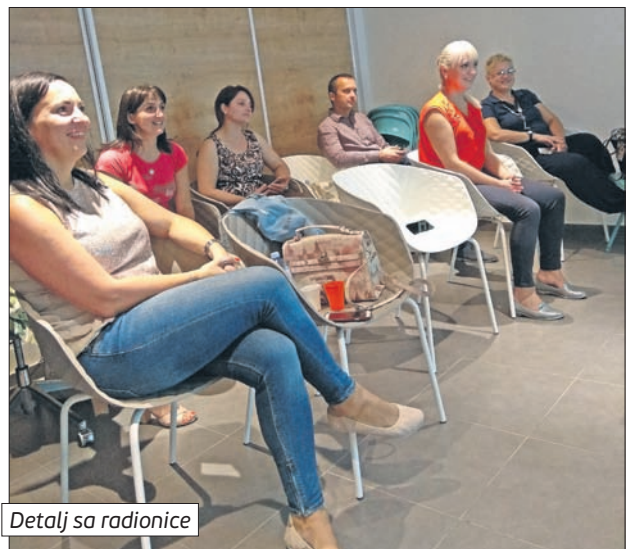
Detalj sa radionice

U Zavodu u narednom periodu očekuju rast nezaposlenosti, iz dva razloga: povratak sezonskih radnika na evidenciju i brojnije prijavljivanje visokoškolača, zbog uključivanja u program stručnog osposobljavanja.