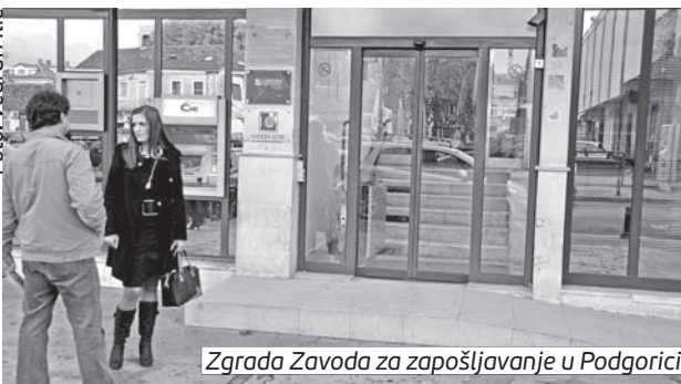
Zgrada Zavoda za zapošljavanje u Podgorici