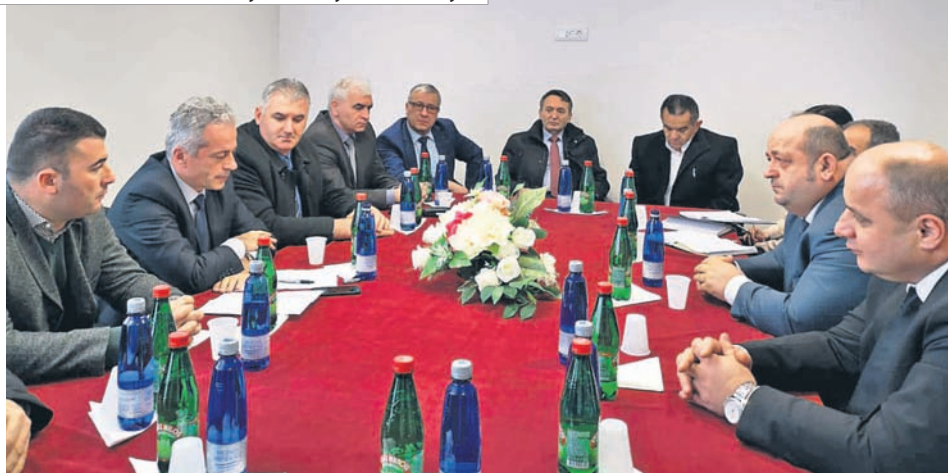
Svečano otvoren višenamjenski objekat u Petnjici

U CRNOJ GORI OPADA REGISTROVANA NEZAPOSLENOST