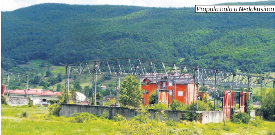
Propala hala u Nedakusima

Iz Udruženja su ranije naveli da je većina tih zahtjeva podnijeta 1992. godine, te da postupci još traju, a jedan je pravosnažno okončan, ali nezakonito sproveden bez prisustva obje strane u sporu. Imovina bivšeg „Transservisa“ u procentu 40 odsto u vlasništvu Udruženja, a ostatak je vlasništvo Investiciono-razvojnog fonda, Fonda PIO i Zavoda za zapošljavanje. B.C.