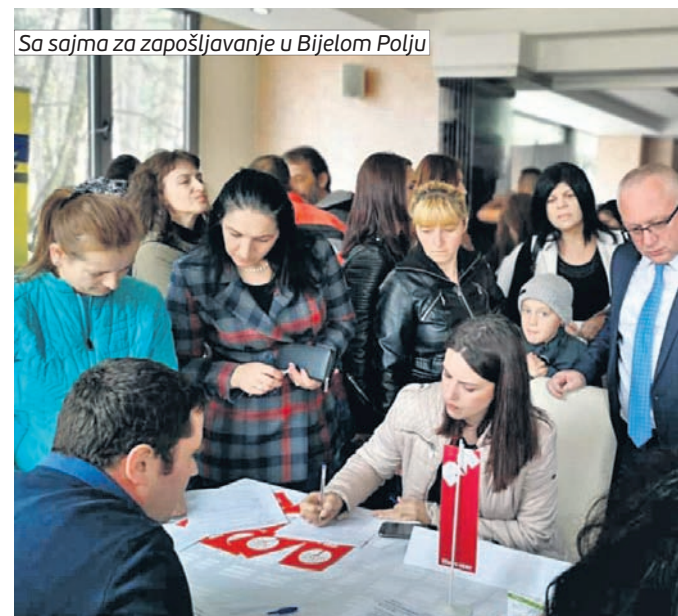
Sa sajma za zapošljavanje u Bijelom Polju

“Na planu podrške otvaranju novih radnih mjesta Opština Bijelo Polje je odredila više biznis zona, kako bi privukla nove investitore i podstakla postojeće na nova ulaganja. U biznis zonama su već otvorene nove fabrike i poslovni objekti, jer su preduzetnicima omogućene značajne olakšice. Takođe kroz intenzivno ulaganje u aktuelne projekte valorizaciju planine Bjelasice i pećine nad Vražijim firovima stvaramo uslove za otvaranje novih radnih