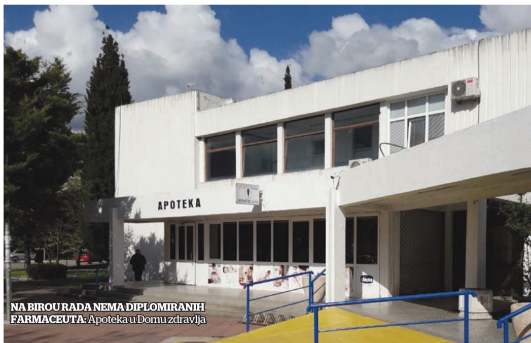
NA BIROU RADA NEMA DIPLOMIranih FARMACEUTA: Apoteka u Domu zdravlja

BAR - Zakon o apotekarskim djelatnostima predviđa nekoliko novina. Jedna od njih je da tokom radnog vremena u apoteci neprekidno mora biti prisutan farmaceut. Upravnica apoteke u Domu zdravlja, diplomirana farmaceutkinja Slobodanka Brnjada, smatra da je to dobro rješenje.