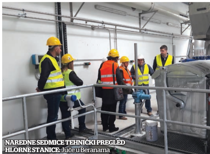
NAREDNE SEDMICE TEHNIČKI PREGLED HLORNE STANICE: Juče u Beranama

Lenoel je obišla hlornu stanicu u Dapsićima, pumpno postrojenje „Centar“ i rezervoar za vodu Jasikovac.