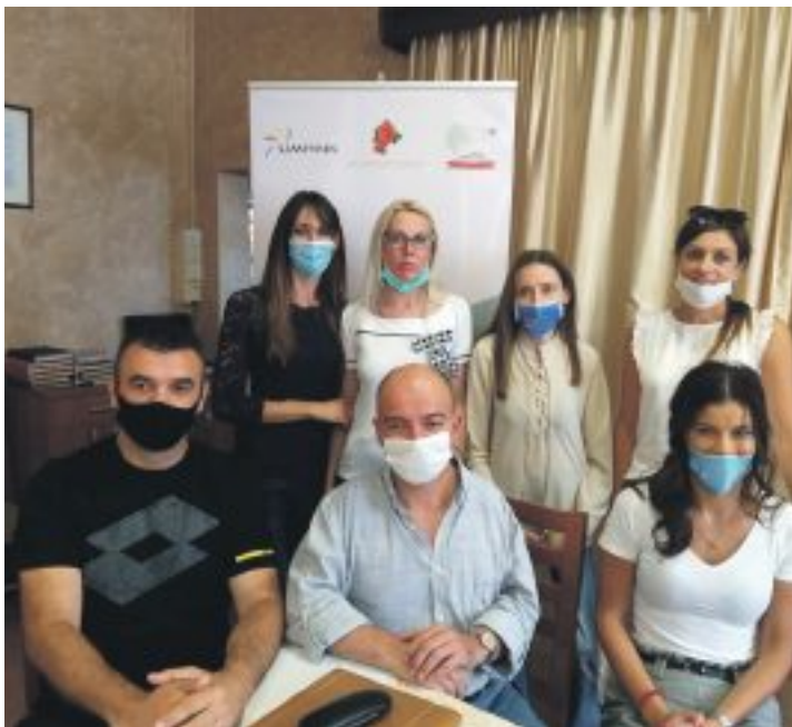
Učesnici projekta

Poslodavci se radije odlučuju da uplate zakonom predviđena sredstva, umjesto da zaposle OSI